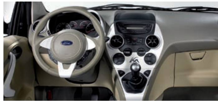
Das Cockpit soll frische Formen mit guter Funktionalität vereinen.

tenseitig in vielerlei Hinsicht auf den neuen Fiat 500 zurück, mit dem er „Hand in Hand“ in Polen vom Band laufen wird.