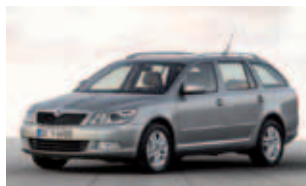
Gefragtestes Importmodell im Flottenmarkt: der Skoda Octavia

Betrachtet man die zehn meistverkauften Modelle im Flottenmarkt 2008, stößt man bis auf zwei Ausnahmen auf die gleichen Vertreter wie im Jahr