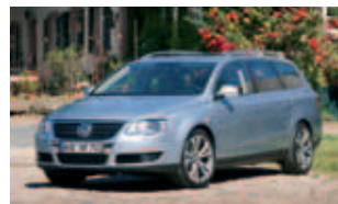
Trotz Verlusten weiter der Flottenbestseller: der VW Passat