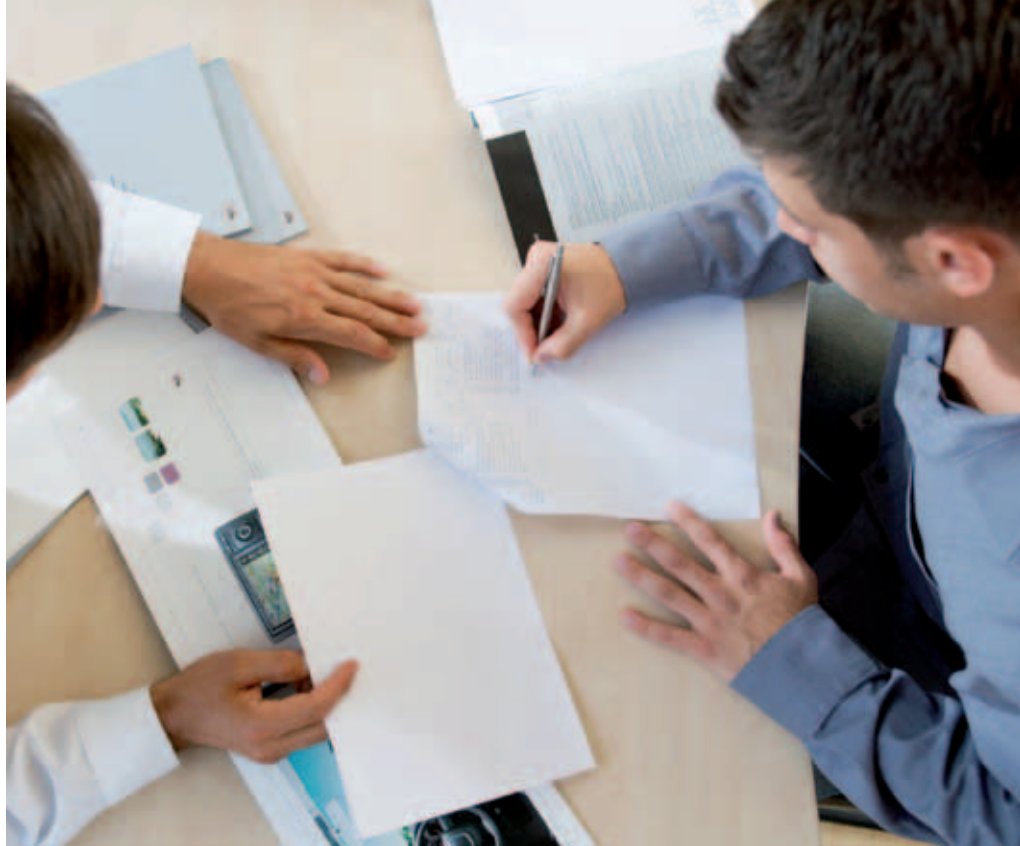
Mietwagen zur Überbrückung von Mobilitätsengpässen eignen sich aufgrund ihrer vertraglichen Flexibilität für alle Fuhrparks – unabhängig von Größe oder Branche.

Mehrkosten entstehen hauptsächlich für Zusatzwünsche des Mieters. So empfiehlt es sich, unverzichtbare Ausstattungsmerkmale vorab unter den Anbietern zu vergleichen: Manche von ihnen lassen sich Winterreifen als Aufpreis be-