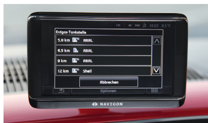
Einmal volltanken | Das VW-Navi (303 Euro) lotst bei Bedarf zur nächstgelegenen CNG-Tankstelle