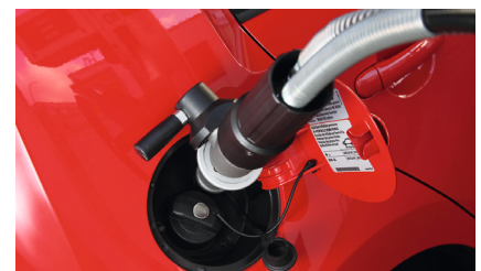
Eins für zwei | Hinter dem Tankdeckel befinden sich Benzineinfüllstutzen sowie Erdgas-Anschluss