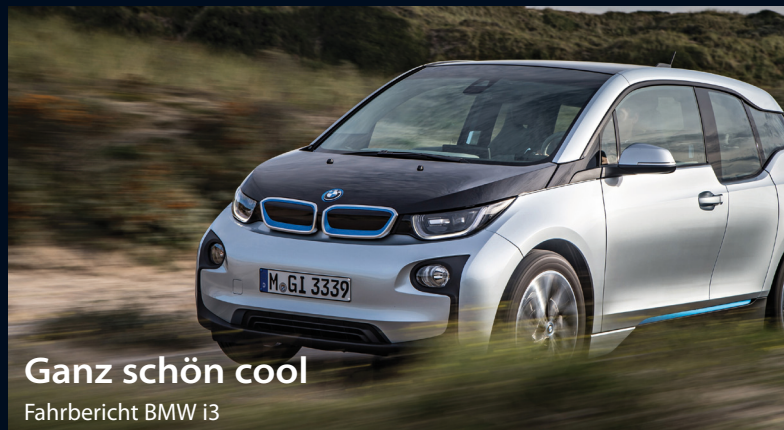
Ganz schön cool Fahrbericht BMW i3