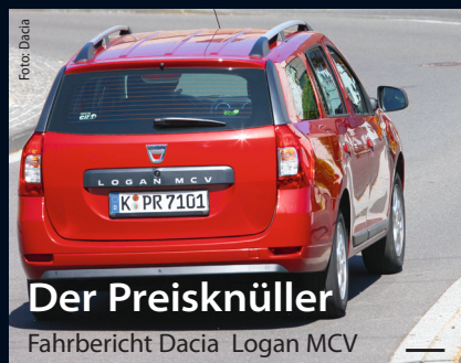
Der Preisknüller Fahrbericht Dacia Logan MCV