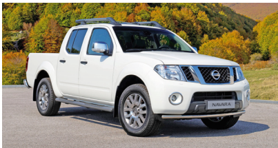
Arbeitsstier | Pick-up in Edeloptik LE EVO

In der neuen Top-Ausstattung bringt der Navara dafür bereits Alcantara-/Lederbezüge für die Sitze, den Schalt- und Handbremshebel und für die Türverkleidung mit. Auch eine Chromumrandung an den Nebelscheinwerfern